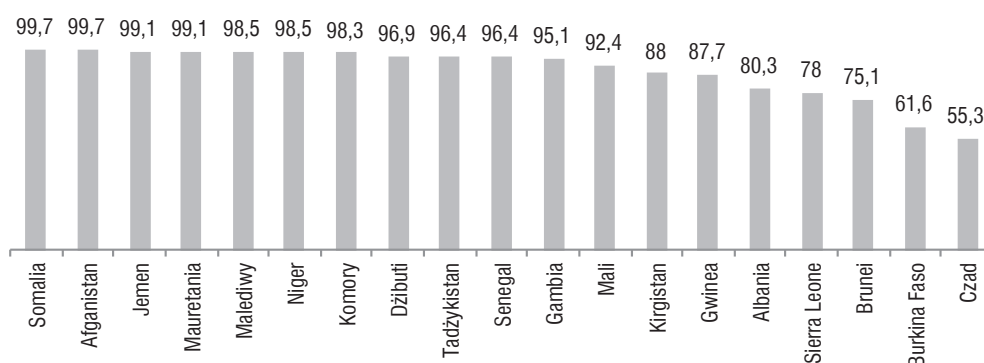
Rysunek 3. Udział wyznawców islamu w państwach OMPE w 2018 r. (w %)