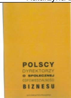
POLSCY DYREKTORZY O SPOŁECZNEJ ODPOWIEDZIALNOŚCI BIZNESU Pod redakcją Piotra Płoszajskiego Wydawnictwo: OpenLinks ; Rok wydania: 2015

Ta książka jest o tym, jak lepsze zrozumienie potencjału mediów społecznościowych pod kątem biznesowym może przynieść korzyści przedsiębiorcom i menedżerom, konsumentom, pracownikom i pozostałym grupom interesariuszy, którzy jak nigdy wcześniej mogą aktywnie włączać się w działania firm.